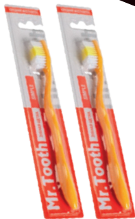
546115 ЗУБНАЯ ЩЕТКА Mr.Tooth Simple

Цены указаны за 1 шт., при покупке 2-х шт. одновременно.