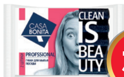
533521 ГУБКА ДЛЯ ПОСУДЫ Casa Bonita Professional 2 шт.