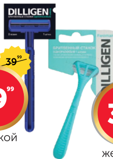
477100, 477096 СТАНОК БРИТВЕННЫЙ DILLIGEN 2 2 лезвия, 1 шт.