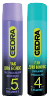
545086, 545087 ЛАК ДЛЯ ВОЛОС CEDRA супер/экстра фиксация с витамином E 225 мл