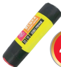
513206 МЕШКИ ДЛЯ МУСОРА Casa Bonita прочные 35л*15 шт.